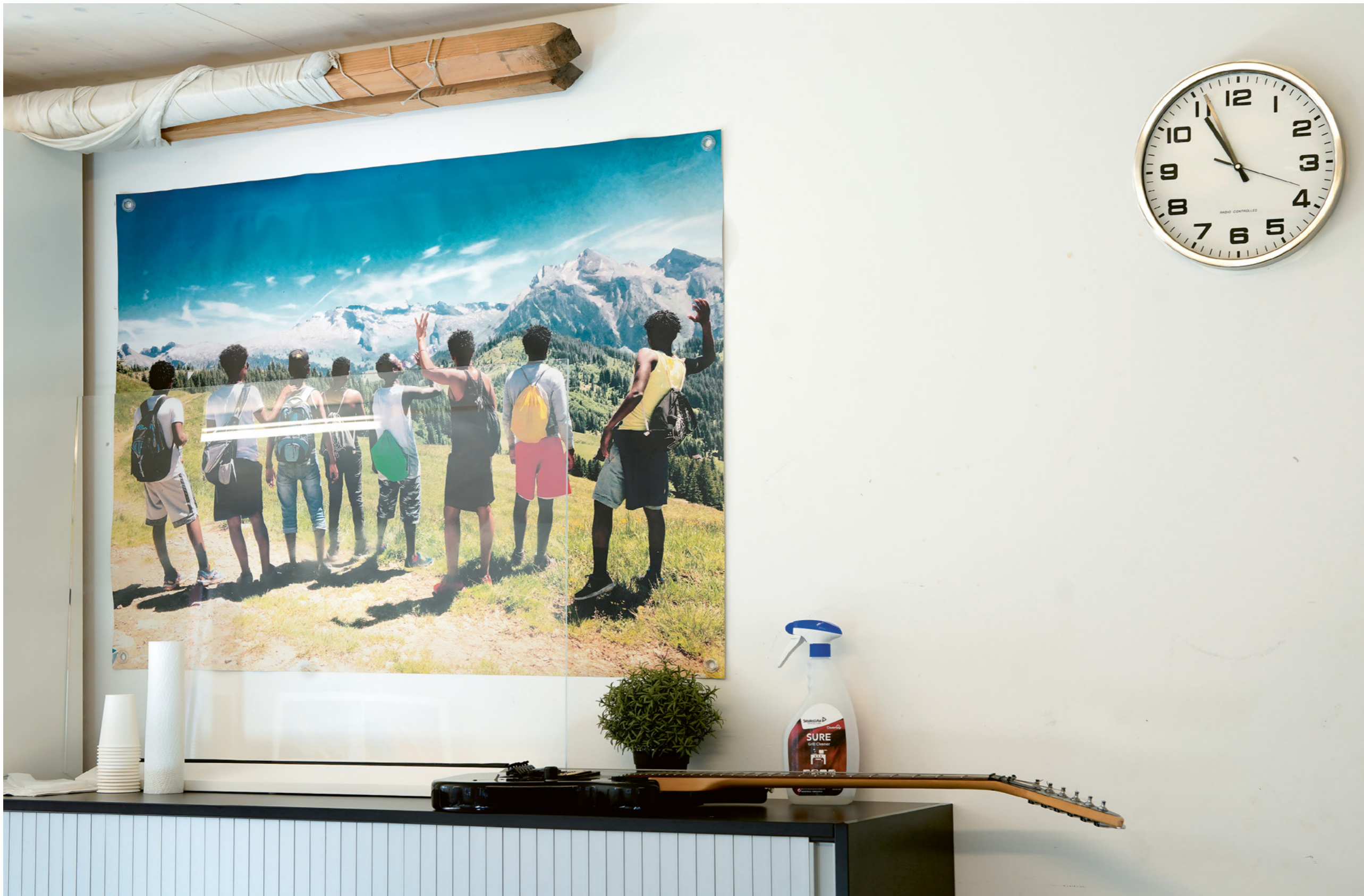
Temporäre Wohnsiedlung Aubruggweg