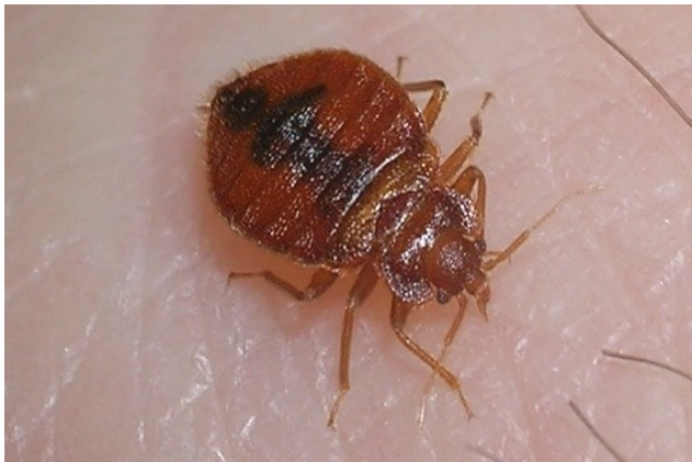
Tartabiqet e rritura tekta ushqehen me gjak.