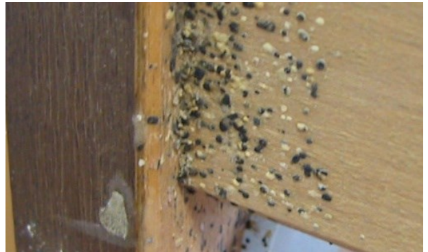
Feçe tartabiqesh në skeletin e krevatit në rast infestimi të rëndë të krevatit.