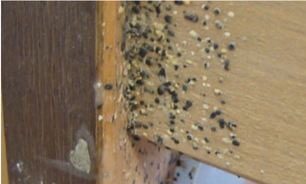
ኩስሊ ባልዕ ዓራት ኣብ መኸግታት ምሒር ዝተወረረ ዓራት። ስእሊ፡- ከተማ Zurich, Environmental and Health Protection