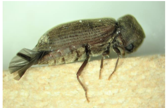
Gut sichtbar ist der Höcker auf dem Halsschild.

Ausgewachsenes Insekt: Der Gewöhnliche Nagekäfer ( Anobium punctatum ) misst 3 bis 5 mm und ist dunkelbraun gefärbt. Das Halsschild überdeckt den Kopf kapuzenförmig und hat in der Mitte einen Höcker. Die Flügeldecken sind mit parallelen vertieften Punktreihen versehen. Die drei Endglieder der Fühler sind verdickt und gleich lang. Wenn der Käfer gestört wird, stellt er sich tot.