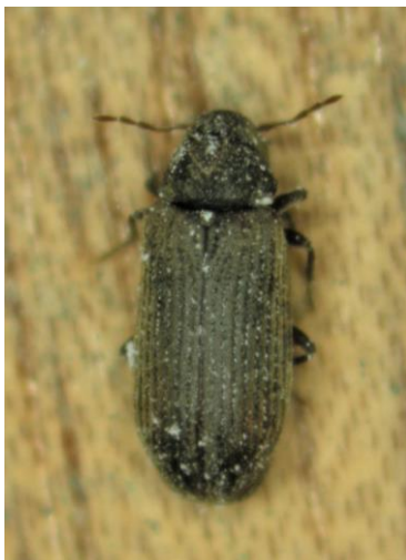
Adulter Holzwurm.