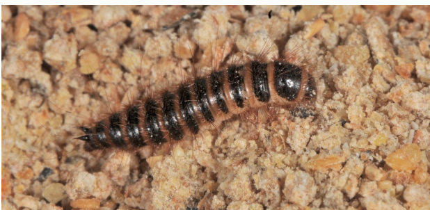
Larve des Speckkäfers mit den charakteristischen Dornen am Körperende (links im Bild).

Larve: Bis 15 mm lang mit heller Unterseite, die Oberseite ist braun gefärbt und trägt lange, braune Haare. Die Segmentgrenzen und die Bauchseite sind gelblich behaart.