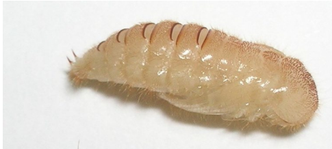
Die Puppe findet man normalerweise nicht, die Larve bohrt sich wenn möglich in festes Substrat, um sich zu verpuppen und vor Fressfeinden geschützt zu sein.

beträgt die Entwicklungszeit etwa 1,5 Monate, bei 15° C etwa 5 Monate. Die Lebensdauer der Käfer beträgt mehrere Monate, bei hoher Luftfeuchtigkeit und 25° C sogar bis zu 300 Tagen.