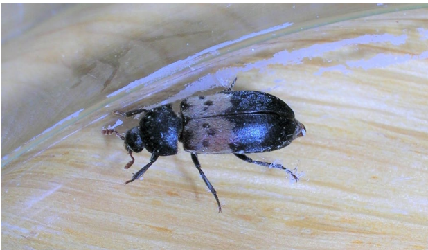
Gemeiner Speckkäfer. Typisch ist das helle Band mit 3 schwarzen Punkten auf den Flügeldecken.

ausgewachsenes Insekt: Bei uns kommen mehrere Speckkäferarten mit einer ähnlichen Lebensweise vor. Neben den braun-schwarz gefärbten Arten gibt es auch den Gemeinen Speckkäfer ( Dermestes lardarius ), der hier stellvertretend für alle Arten beschrieben wird. Die 7 bis 9 mm langen Käfer haben Flügeldecken, welche auf der vorderen Hälfte weisslich behaart sind mit je drei dunklen Flecken. Die Bauchseite ist grau behaart.