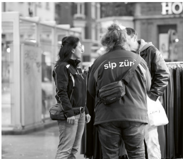
Jeden Tag patrouilliert sip züri auf den Strassen der grössten Schweizer Stadt. Ihr Auftrag: Ansprechen, Vermitteln, Helfen.

sip züri fördert durch Konfliktvermittlung das rücksichtsvolle Verhalten, die gegenseitige Toleranz und damit die Sicherheit aller Personen im öffentlich zugänglichen Raum und beaufsichtigt exponierte Einrichtungen des Sozialdepartements wie die Kontakt- und Anlaufstellen für Drogenabhängige sowie den Strichplatz. Die Teams schlichten bei Streit und Lärm, schreiten bei Littering ein, bieten in Notsituationen direkte Hilfe vor Ort und betreiben ambulante Sozialarbeit in Form von Beratung, Vermittlung und Krisenintervention. Am 12. Februar 2017 stimmt die Zürcher Stimmbevölkerung ab über die neue Rechtsgrundlage, die die Aufgaben von sip züri zeitgemäss abbildet. Der Gemeinderat hat die Vorlage Anfang Oktober 2016 angenommen.