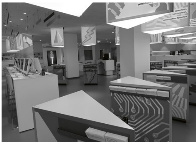
Modern und zeitgemäss – so präsentiert sich das Laufbahnzentrum seit dem 20. September 2016.

Nach einer dreimonatigen Umbauzeit wurde der neu gestaltete Kundenbereich im Erdgeschoss am 20. September 2016 mit inhaltlich modernisiertem Konzept eröffnet. Bunte, nach den neun Berufsinteressenfeldern gestaltete Stelen lassen die Besucherinnen und Besucher in die Berufswelten eintauchen und regen zu beruflichen Wegen, ob Grundbildung oder Weiterbildung, an. Die vielen Informationen sind systematisch und digital aufbereitet. Mittels QR-Code auf den Printprodukten besteht eine ideale Verbindung zu den digitalen Informationen. Weiterhin werden Kurzberatungen und Unterstützung bei persönlichen Fragestellungen angeboten. Mit den Angeboten «Job-Check» und «Bewerbungscheck» werden Kundinnen und Kunden vor einem Stellenwechsel oder einer Neuorientierung beraten. Die Sprechstunde für Migrantinnen und Migranten unterstützt bei der Integration in den Schweizer Arbeits- und Bildungsmarkt. Der Besuch im LBZ ist ohne Anmeldung während der Öffnungszeiten möglich. Während des Umbaus wurde der Betrieb im ersten Stock reduziert weitergeführt. Deswegen gingen die Besucherzahlen und Beratungen im gesamten Haus zurück.