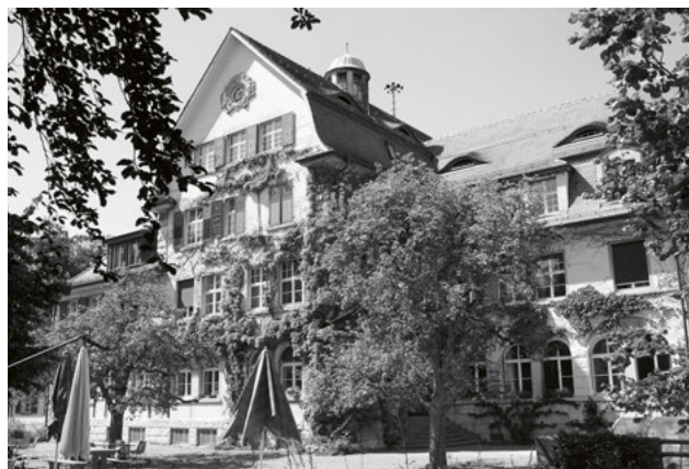
Das Kinderhaus Entlisberg beherbergt seit einem Vierteljahrhundert städtische Kita-Angebote.

Am 20. September lud das Kinderhaus Entlisberg Fachpersonen, Beteiligte und Interessierte anlässlich seines 25-jährigen Jubiläums zu einem «Abend der offenen Tür» ein. Das ehemalige Waisenhaus beheimatet heute neben der ersten städtischen Kita einen Hort und zwei weitere Kitas, von denen eine einen 24-Stunden-Betrieb für schichtarbeitende Eltern unterhält. Zudem bieten die Krisenintervention, ein stationäres Angebot, im Rahmen von Kinderschutzverfahren sechs Plätze sowie der Offene Bereich niederschwellige Angebote im Frühbereich an. Das über 100-jährige Gebäude soll von Frühsommer 2018 bis Herbst 2019 umfassend saniert werden. Für die Umbauphase sind Räumlichkeiten in temporären Pavillons auf dem Gelände vorgesehen. Auch die 200-jährige Liegenschaft des Kinderhauses Artergut ist renovationsbedürftig. Die Gruppen werden während der Renovation im Herbst-/Winterhalbjahr 2017/18 ein Provisorium an der Oberen Zäune beziehen.