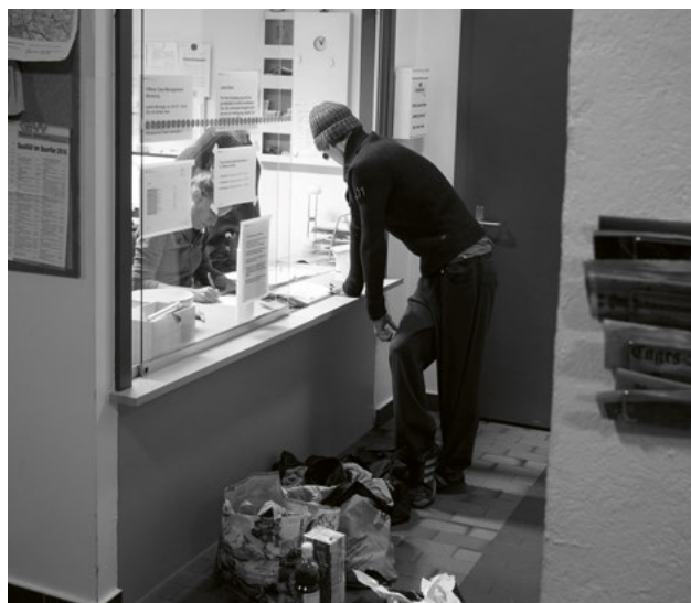
Die Notschlafstelle verzeichnete im April 2016 die höchsten Besucherzahlen.

In der städtischen Notschlafstelle an der Rosengartenstrasse wurden 2016 weniger Übernachtungen registriert als in den Jahren zuvor (2016: 11 735, 2015: 13 415, 2014: 14 623). Die durchschnittliche Belegung lag bei 32 Personen pro Tag, das Maximum bei 46 Personen. Am höchsten war die Auslastung im April mit 37, am tiefsten im November mit 26 Personen im Schnitt. Die Notschlafstelle verfügt regulär über 52 Schlafplätze, bietet aber in einer Notlage mit zusätzlichen Betten und Matratzen Platz für bis zu 80 Personen. Somit können auch Spitzenzeiten problemlos bewältigt werden. Das Durchschnittsalter lag 2016 bei 42 Jahren. 25% der Nutzerinnen und Nutzer waren Frauen, für die in der Notschlafstelle eine eigene Etage zur Verfügung steht.