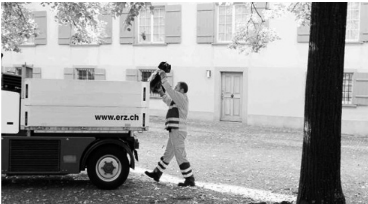
An jedem Tag des Jahres sind die Teams der Stadtreinigung für ein sauberes Zürich unterwegs.

Der Stadtrat hat im Oktober die neue Klärschlamm-Entwässerungsanlage bewilligt. Neu soll der Klärschlamm nicht mehr durch eine Presse auf einen Trockensubstanzgehalt von 30% entwässert werden, sondern durch drei Zentrifugen, so genannte Dekanter, im Durchlaufbetrieb behandelt werden. Die neue Anlage wird in einem Teil der bestehenden Schlammumschlaghalle erstellt. Das alte, 50-jährige Schlammgebäude wird nach Inbetriebnahme der neuen Anlage abgerissen.