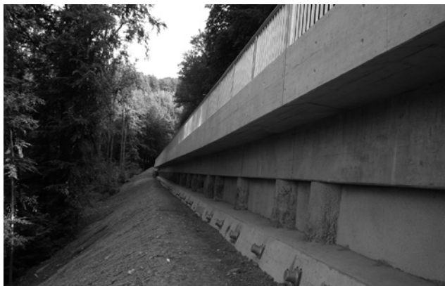
Die neue Stützkonstruktion Schlyfi.

Weitere geplante Massnahmen der FlaMa West sind die Neugestaltung der Haltestelle Morgental mit behindertengerechtem Zugang zu Tram und Bus. Dies hätte eine wichtige Aufwertung des Morgentals zur Folge. Der Kanton beurteilt das Projekt kritisch, trotzdem wird weiter daran gearbeitet. Im Sommer 2008 soll es durch den Stadtrat festgesetzt und anschliessend dem Regierungsrat vorgelegt werden.