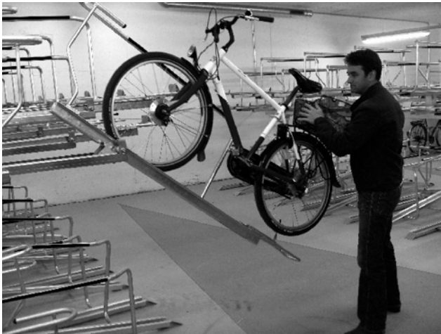
Doppelstöckige Veloparkplätze in der neuen Velostation Süd.

An der Veloaktion «Bike to Work» von Pro Velo haben im Juni über 1000 städtische Mitarbeitende (davon 30 des TAZ) in 270 Teams teilgenommen. Sie benutzten an mindestens der Hälfte ihrer Arbeitstage wenigstens für eine Teilstrecke das Velo. Sie radelten im Aktionsmonat gesamthaft 120 000 Kilometer, die acht TAZ-Teams legten 4000 Kilometer zurück.