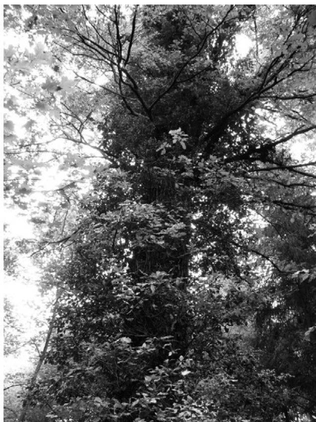
Neben dieser stattlichen Eiche im Waldstück Notzenschürli beim Friedhof Höngerberg werden seit 2003 Aschenbeisetzungen durchgeführt.

Für die Erarbeitung eines Friedhofkonzepts wurden die aktuellen Entwicklungen in zwei Studien untersucht: Eine ethnologische Studie den Wandel der Bestattungskultur in der Stadt Zürich. Die Studie zeigt, dass eine klare Tendenz weg von den traditionellen und eingeschränkten Bestattungsformen hin zu mehr Eigenverantwortung und Individualität zu erkennen ist. Deutliches Zeichen dieser Entwicklung ist die Aschenbeisetzung im Wald, die sich grosser Beliebtheit erfreut. Eine statistische Studie analysiert die Entwicklung der Sterbezahlen und der Grabtypenwahl in den letzten 15 Jahren; sie prognostiziert den zukünftigen Gräberbedarf in den einzelnen Quartieren. 2007 konnten für alle Friedhofsanlagen die mittel- bis langfristigen Grabfeldpläne erarbeitet werden. Sie zeigen für die einzelnen Friedhöfe den aktuellen Belegungszustand, die Reserveflächen und die zu erwartende Belegung.