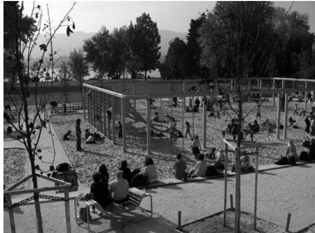
Der neu gestaltete Spielplatz am Zürichhorn.

hen. Im Frühling wurden die Submissionen durchgeführt, und nach Baubeginn standen zunächst die Leitungsbauten und die Altlastensanierung im Vordergrund. Der Baumtopf konnte fertig gestellt werden.