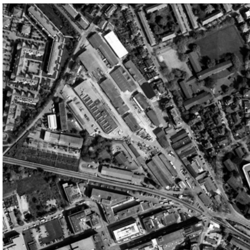
Das Gebiet zwischen SZU-Haltestelle Binz und der Bühlstrasse 1999. (Bilder: GeoZ)

Bedingt durch die starke Bautätigkeit bearbeitete GeoZ ein grosses Auftragsvolumen. In der amtlichen Vermessung waren dies hauptsächlich Grenzmutationen infolge von Parzellenteilungen, Strassen- und anderen Bauprojekten. Im Bereich Bauvermessung war die Baustelle Stadion Letzigrund ein Grossauftrag. Weitere Grossaufträge waren die Grossbaustellen in Zürich-Nord.