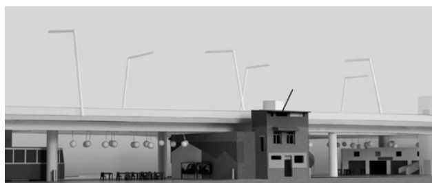
Escher-Wyss-Platz: Siegerprojekt «Nagelhaus».

Das Siegerprojekt «Nagelhaus» stammt vom Team Caruso St. John Architects LLP (London) und Thomas Demand (Berlin); es verarbeitet das Thema des Umbruchs in Zürich-West auf künstlerische Art. Einem neuen Stück Stadt gleich werden zwei Gebäude unter der Hardbrücke platziert. Im einen ist ein Restaurantbetrieb mit Aussenbestuhlung vorgesehen, das andere dient als Kiosk. Für das Feld zwischen den Gebäuden sind Leuchten in Form von Lampions geplant, derzeit wird abgeklärt, ob dies machbar ist.