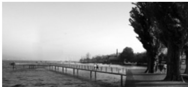
Der neue Seeuferweg beim Hafen Wollishofen.

die Schiffsdurchfahrt sichergestellt. Bis im Sommer 2008 sollen Kanton und Gemeinderat über das Projekt befinden. Bei Zustimmung kann der Bau voraussichtlich im Herbst 2008 beginnen, er dauert rund sechs Monate.