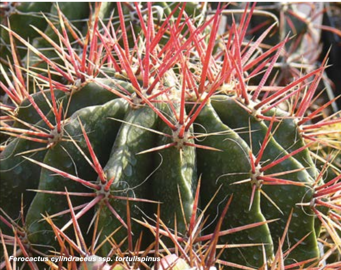
Ferocactus cylindraceus ssp. tortulispinus